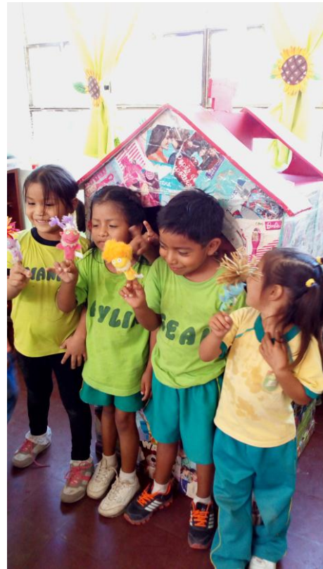
Sesiones del programa de títeres