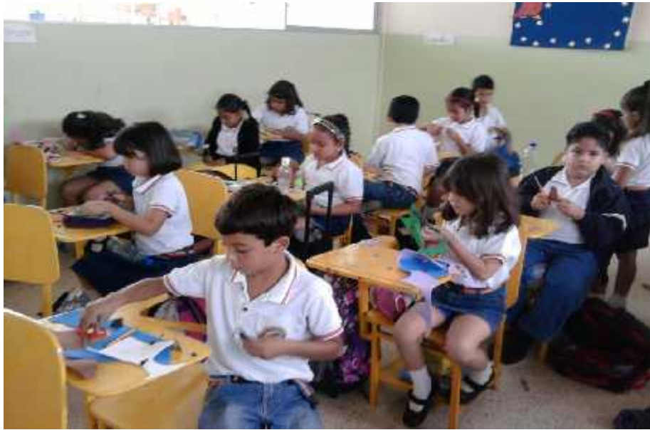
Niños de Tercer Año Básico construyendo sus títeres con materiales como Fomi y botellas plásticas.