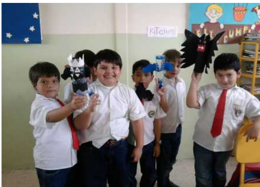
Muy contentos disfrutaron de la clase.