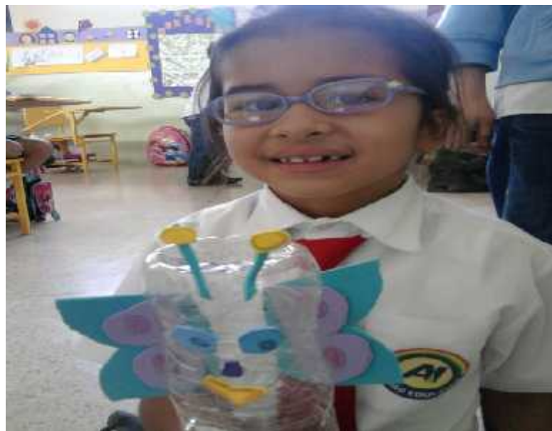
Feliz después de haber terminado de construir su títere.