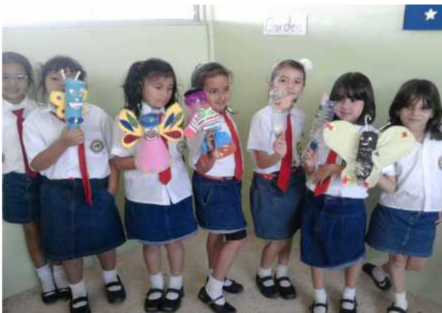
Niñas de Tercer Año Básico, muestran sus títeres terminados.