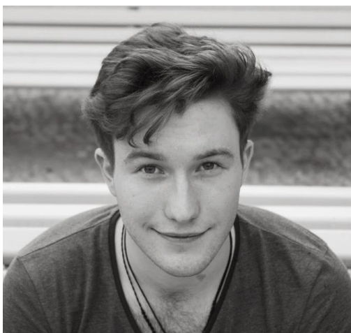
Abb. 6: Puppenspieler der Auswertung