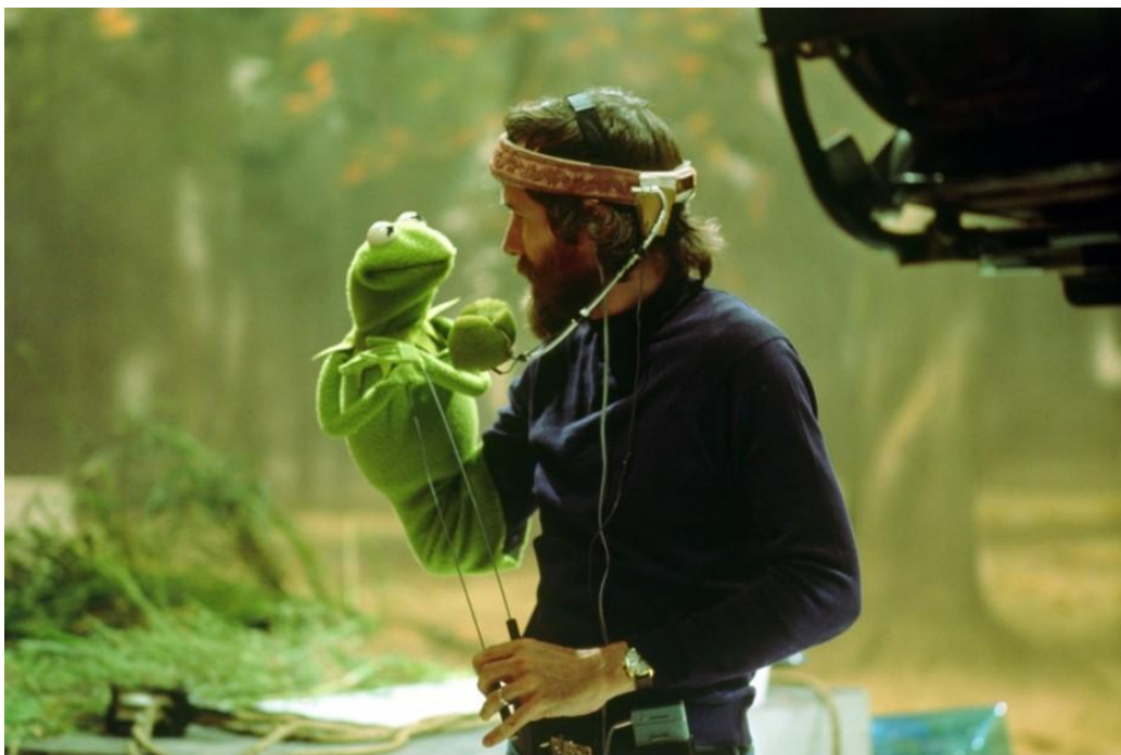
Abb. 1: Kermit der Frosch als Klappmaulpuppe mit Stäben und Jim Henson

Das sicherlich berühmteste Beispiel für eine Klappmaulpuppe mit Stäben ist Kermit der Frosch aus der Sesamstraße. Bei Kermit ist der Puppenspieler neben der Puppe im Fernsehen nicht zu sehen. 75 Im Experiment des vierten Kapitels werden die Studenten aus Forschungszwecken jedoch neben ihren Puppen zu sehen sein.