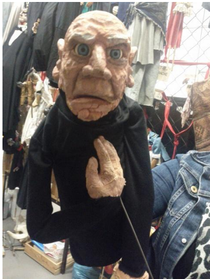
Abb. 3: Klappmaulpuppe mit Führungsstab, rechts