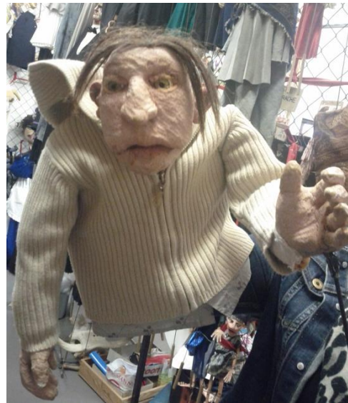
Abb. 2: Klappmaulpuppe mit Führungsstab, rechts

Die Klappmaulpuppe ist eine neuere Form der Handpuppe. Sie ist in den siebziger Jahren entstanden 97 und bekannt aus der Sesamstraße. 98 Die Stabpuppe ist eine Variation der Stockpuppe und wird auf Grund der Vitalität ihrer Bewegungen oft in der Kombination mit anderen Puppenarten verwendet. 99 Mit der Klappmaulpuppe, ohne Stäbe an den Händen, werden häufig Tiere oder Ungeheuern dargestellt. Bei der Darstellung eines menschlichen Wesens durch eine Klappmaulpuppe, kann die Klappmaulpuppe mit einer Stabpuppe kombiniert werden. 100