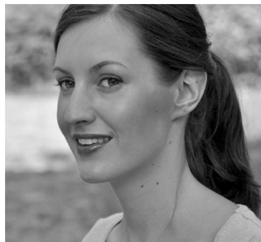
Abb. 5: Puppenspielerin der Auswertung