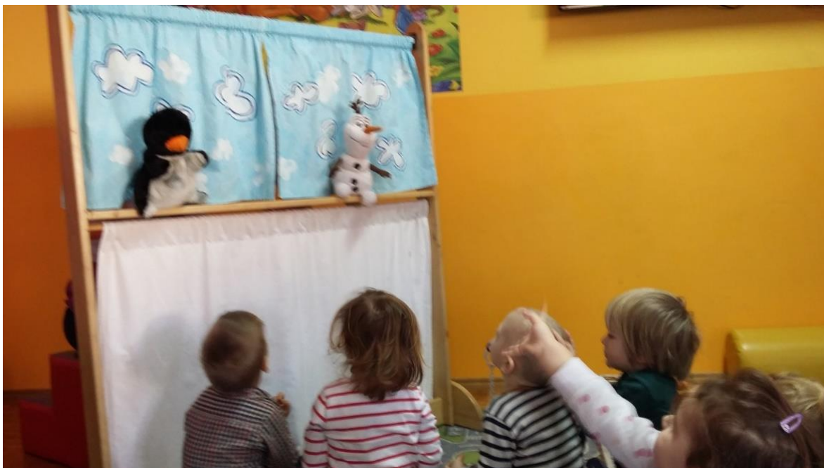
Slika 1: Predstava potaknuta igračkom jedne djevojčice „Snjegović i pingvin“

Odgojitelji u dječjem vrtiću koji na različite načine svakodnevno komuniciraju s djecom uz pomoć lutke uočavaju velike pedagoške potencijale lutke. Svaku stvar iz svoje svakodnevnice možemo oživiti i dati joj simboličko značenje. Ako dijete ima mogućnost uživljanja svijeta oko sebe, dobiva priliku vidjeti taj svijet iz druge perspektive, čime stječe mogućnost razvijati se prema vlastitom razvojnom obrascu. Zato je važno znati kako se odgojitelji služe lutkom u radu s djecom te kako definiraju pedagoški kontekst u kojem djeca s lutkama stječu iskustva i razvijaju svoje kreativne i sve druge sposobnosti. Upravo zbog toga jer je utemeljena na snažnoj emotivnoj vezi, scenska je lutka vrijedno i moćno sredstvo i pomagalo za rad s djecom. Ona je savršena didaktička igračka u rukama djece a kao sredstvo za rad u rukama odraslog ima bezgraničnu moć. Iako dijete zna tko pokreće lutku, ono što lutka kaže i napravi „zakon je“ za dijete jer ona pokreće njegove emocije, stimulira njegova osjetila, pa izrečeni sadržaj uvijek mora biti pomno odabran. S lutkom izravno utječemo na razvoj crta ličnosti (pravednost, prijateljstvo, hrabrost, toleranciju).