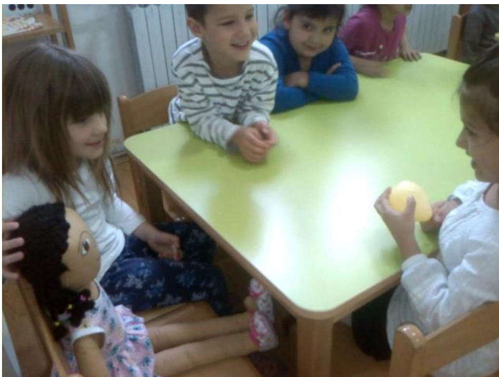
Slika 3: Razgovor s lutkom Nurom