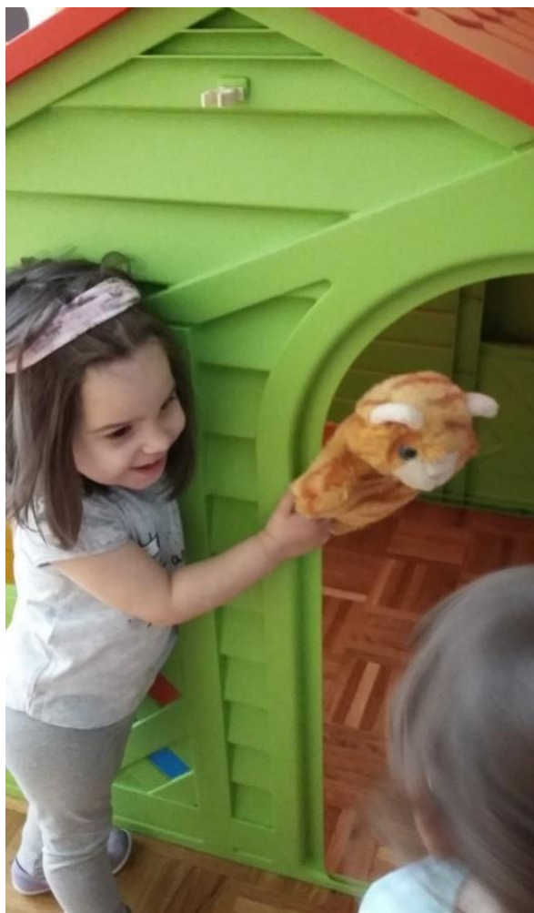
Slika 4: Djevojčica nakon predstave “Znatiželjna maca” improvizira pred prijateljicom