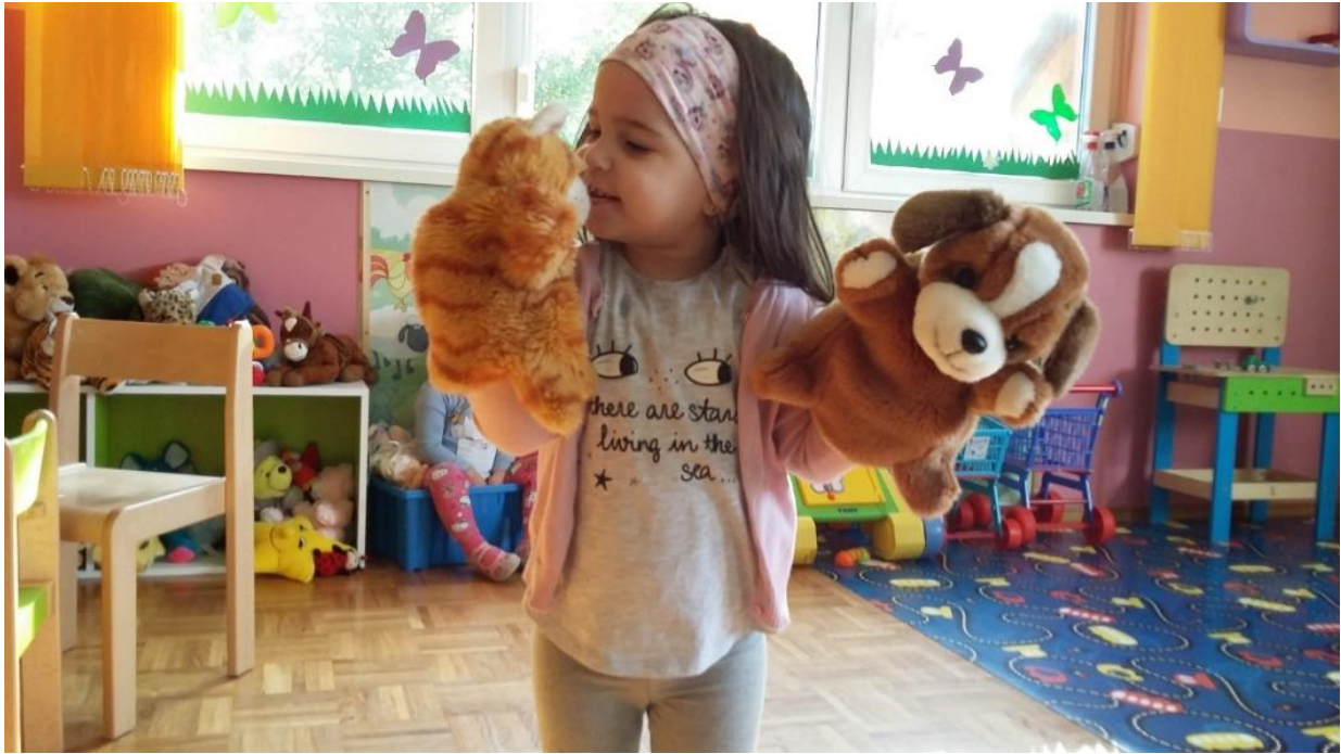
Slika 2: Modeliranje s lutkom u jaslicama

Simboličko modeliranje znači oponašanje ponašanja koje je vidjelo na televiziji ili u knjigama. Kako bismo potaknuli djecu na igru s lutkom, potrebno im je pričati priče i bajke, izvoditi lutkarske predstave u vrtiću, odvesti ih u kazalište i dr.