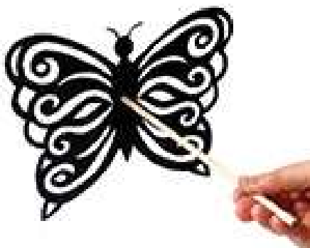
Slika 5: Senčna lutka, s črno senco na platnu

Senčne lutke so po svoji tehnologiji ploske, imajo le dve dimenziji: širino in višino. Delimo jih v dve skupini: prve so tiste, ki so izdelane iz kartona, papirja in vezane plošče, njihova senca na platnu pa je črna. Druge pa so tiste, ki jih izdelamo iz prosojnih materialov (celofan, svila ...) in jih pobarvamo s tuši ali naravnimi prosojnimi barvili. Njihova senca je barvna.