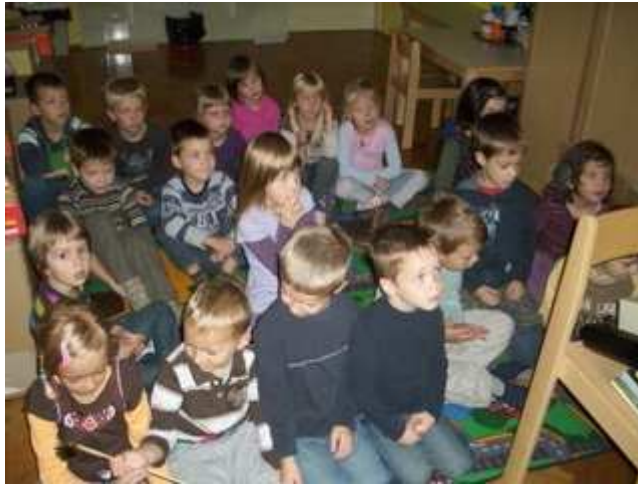
Slika 8: Opazovanje senčnih lutk od blizu