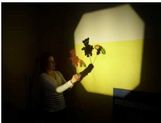
Slika 7: Opazovanje senc