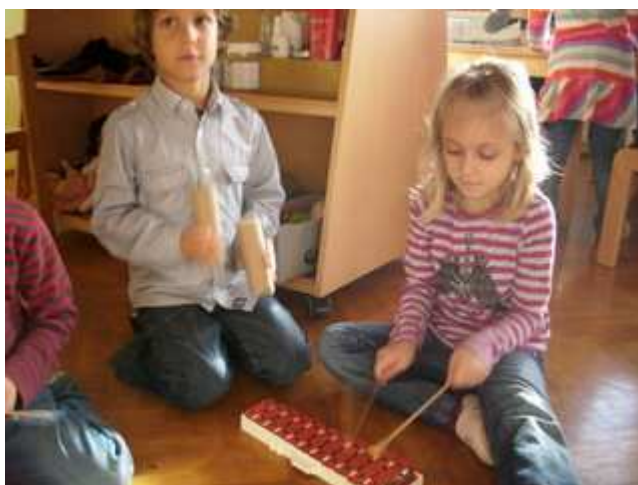
Slika 18: Otroci, ki igrajo na glasbila