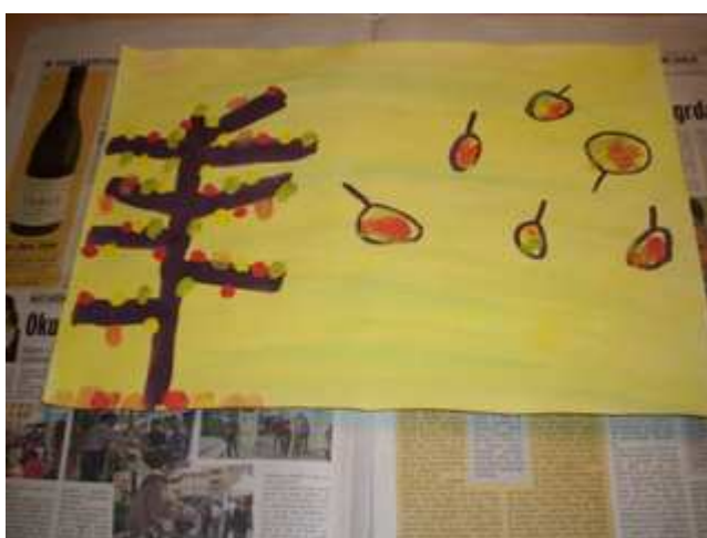
Slika 15: Risba za ozadje