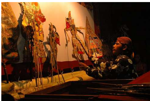
Slika 1: Dalang

Po stari tradiciji liki ne posnemajo realistično človeka in njegovih gibov, pač pa jim posebna oblika in členjenje rok omogočata prepričljivo in zanimivo lutkovno gibanje. Lutke so izdelane iz poslikanega pergamenta – iz prosojno strojene bivolove kože, ojačane s koščeni in lesenimi vodili (Majaron, 1986).