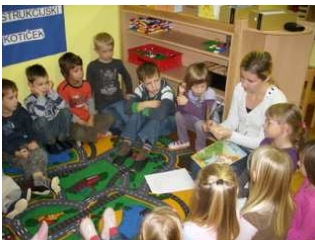
Slika 6: Seznanjanje z zgodbo

Menimo, da so bili cilji, ki smo si jih zastavili, uresničeni. Otroci so spoznali novo zgodbo in se seznanili s senčnimi lutkami. Pri samem ustvarjanju senc so z različnimi predmeti spoznavali in raziskovali njihove lastnosti.