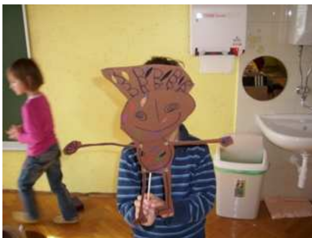
Slika 12: Senčna lutka – Škoržek