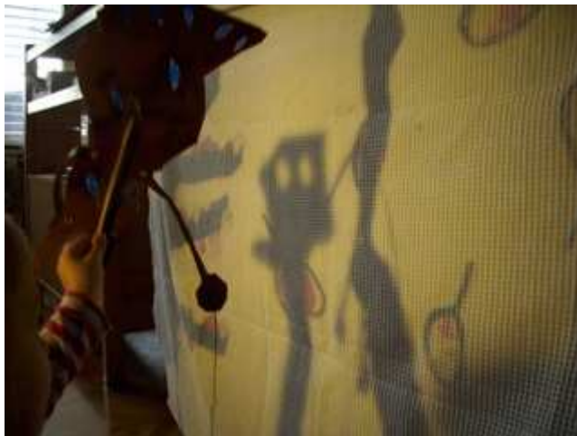
Slika 17: "Škoržek"