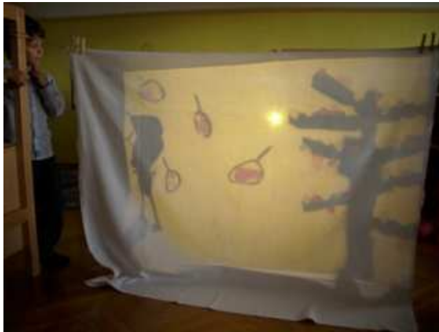
Slika 19: Pogled od spredaj