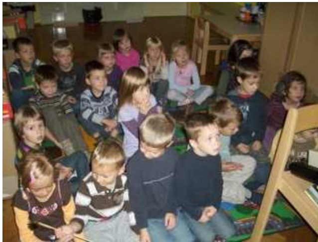
Slika 8: Opazovanje senčnih lutk od blizu