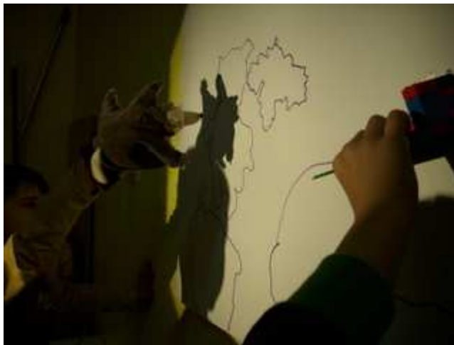
Slika 9: Obrisovanje in opazovanje senc