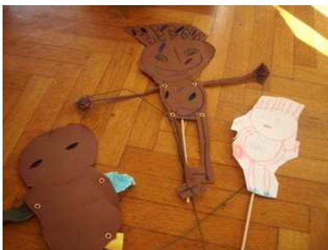
Slika 13: Končane senčne lutke