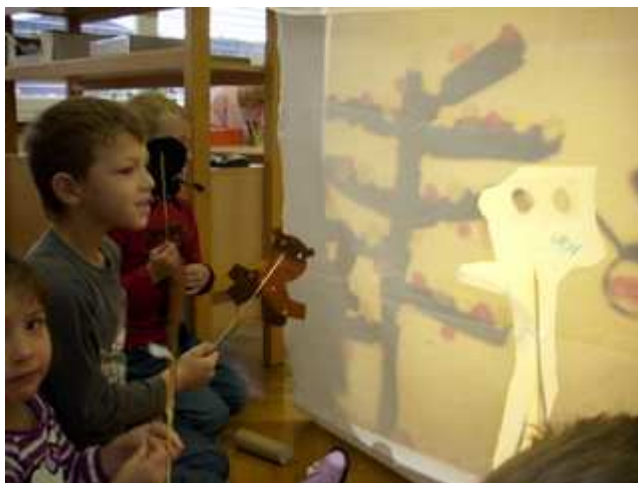
Slika 16: Priprave na dramatizacijo