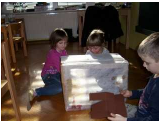
Slika 14: Spontana igra senc