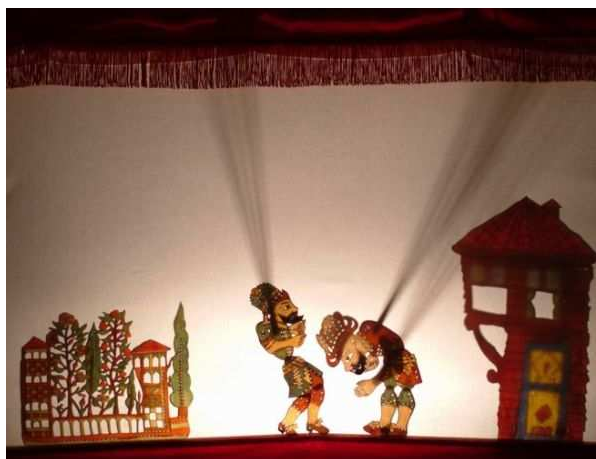
Slika 2: Gledališče Karagos

Sodobno senčno gledališče največkrat črpa iz tradicionalnih gledališč orientala in prilagaja estetiko in sporočilnost glede na čas in prostor. Osnovni princip senčnega gledališča se pri vseh oblikah kaže podobno, razlikuje se med seboj le v postavitvi luči, kvalitete materiala lutke in kvalitete platna, na katerega se projicira sence (Trefalt, 1993, str. 62).