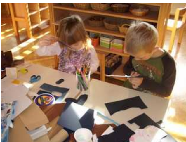
Slika 10: Izdelovanje senčnih lutk

Menim, da so bili zastavljeni cilji uresničeni.