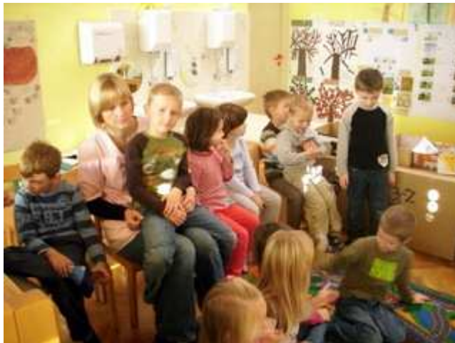
Slika 20: Občinstvo