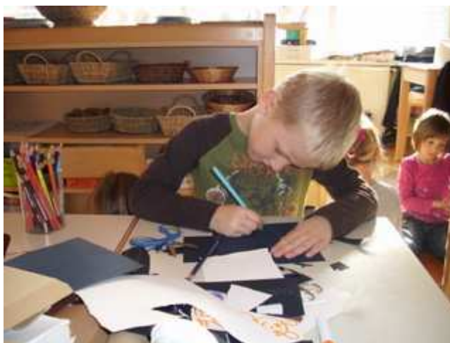
Slika 11: Skiciranje senčne lutke