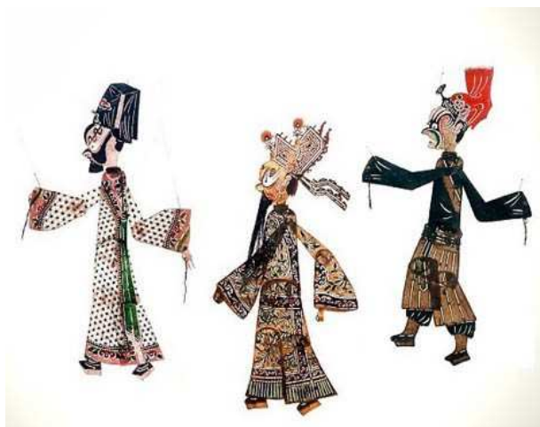
Slika 3: Kitajske senčne lutke