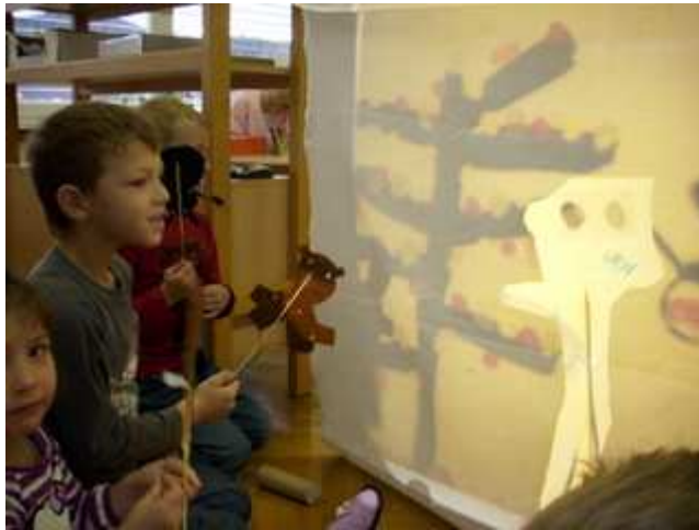
Slika 16: Priprave na dramatizacijo