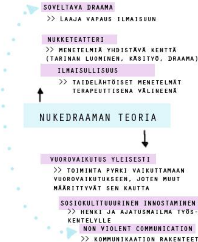
Kuvio 1. Nukkedraaman sisältämät teoriat suhteessa toisiinsa

Nukkedraaman pääasiallinen tavoite on tukea ja edistää vuorovaikutusta, jolloin kaikki sen sisällä tehtävä toiminta linkittyy jotenkin vuorovaikutukseen ja sen osa-alueisiin. Nukkedraaman suhtautuminen vuorovaikutukseen määrittyy pitkälti sosiokulttuurisen innostamisen ajatusten kautta. Näiden ajatusten lisäksi kommunikaation rakenteisiin pureudutaan Non-violent communicationin ajatuksista käsin. Nonviolent communication tarjoaa selkeät kohdat, joihin puuttamalla vuorovaikutusta voidaan edistää.